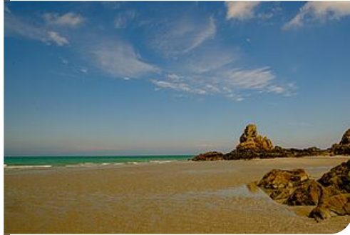
Plage de Béliard