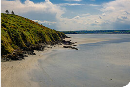
la côte d'Hillion

La suite du chemin n'est pas moins spectaculaire puisqu'il mène au bout de la presqu'île d'Hillion, à la Pointe du Groin puis à la Pointe des Guettes.