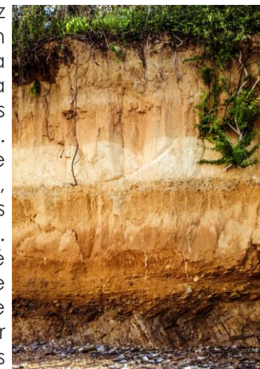
Falaise de l'Hôtellerie

De la digue de Pissoison, vous pourrez découvrir l'anse d'Yffiniac dans son ensemble, de la Pointe du Roselier à Plérin à la Pointe du Grouin à Hillion. Plus loin, la Pointe de Billemont permet l'observation des bernaches en hiver ainsi que des échassiers. Vous arriverez ensuite sur la plage de l'Hôtellerie, où se dresse une falaise abrupte, découvrant différentes périodes géologiques, témoins de l'histoire de la Terre. Enfin, vous emprunterez un sentier aménagé accessible à tous. Vous terminerez votre balade à la Maison de la Baie, où une boutique et un espace muséographique sur la flore et la faune de la baie vous attendent.