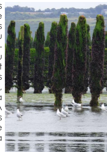
Moules sur bouchots – A.Galli

De la Maison de la baie, le sentier des douaniers se fraye un chemin au travers de haies de Prunelliers, d'Aubépines et d'Ormes mêlés. En l'empruntant, vous arriverez au havre de paix de Saint Guimond, rendez-vous des pêcheurs à pied. De la Pointe du Grouin, vous aurez un panorama complet de l'anse d'Yffiniac et sur ses filières. Puis vous continuerez sur la Pointe des Guettes, où une table de lecture vous expliquera clairement le paysage qui s'offre à vous. A marée basse, vous pourrez y voir les vastes étendues de bouchots destinés à l'élevage des moules, dont la production s'élève à 5000 tonnes par an.