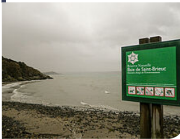
20 panneaux de limite