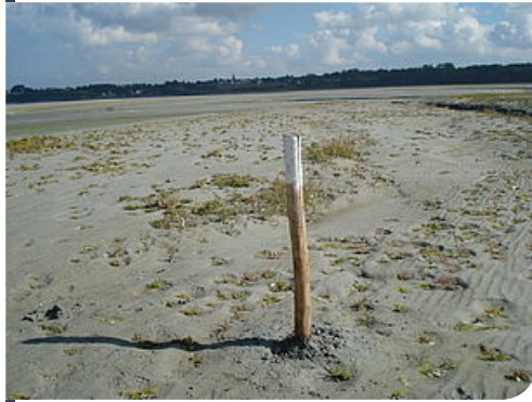
chemin de boutdeville