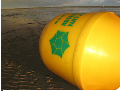
bouée de délimitation