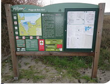
6 panneaux d'entrée de site