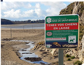
14 panneaux chiens en laisse