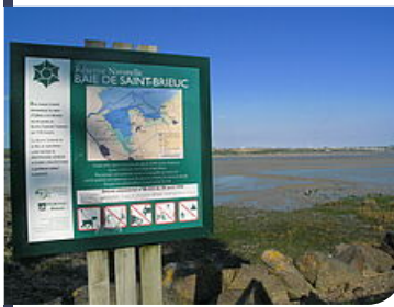
8 panneaux d'information